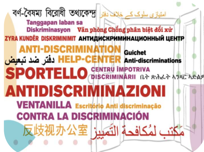
Το SPAD (Γραφείο για την Καταπολέμηση των Φυλετικών Διακρίσεων)