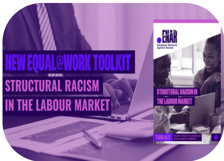
Η «δέσμη εργαλείων για τον δομικό ρατσισμό στην αγορά εργασίας» του ENAR