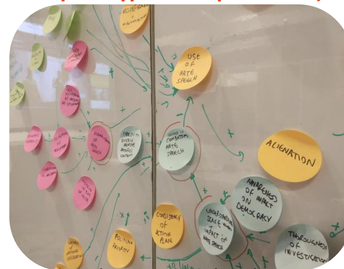
Χαρτογράφηση εθνικών μέτρων κατά της ρητορικής μίσους στην Ισπανία